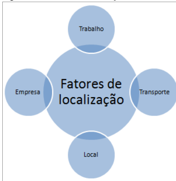
Figura 2 – Fatores de localização